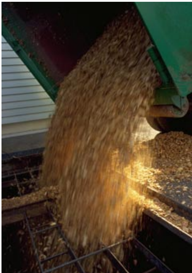
Das Silo wird pro Heizperiode 4- bis 6-mal befüllt.

Holz-schnitzelheizungen bestehen aus 5 Teilen: dem Brennstoffsilo mit Befülleinrichtung und Siloaustragung, der Schnitzeltransportanlage zum Heizkessel, dem Heizkessel, der Kaminanlage und dem Wärmeabgabesystem. Ein Wärmespeicher, wie ihn Stückholzfeuerungen erfordern, ist nicht nötig, in gewissen Fällen aber empfehlenswert – zum Beispiel in Kombination mit einer Solaranlage.